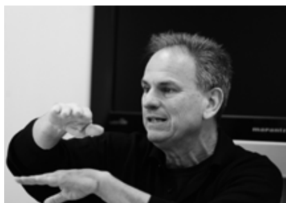
אבי נשר, עריכת פיצ'ר

שנה א': ימים א' ו-ד' (19.5 ש"ש) שנה ב': ימים א' ו-ד' (19 ש"ש)