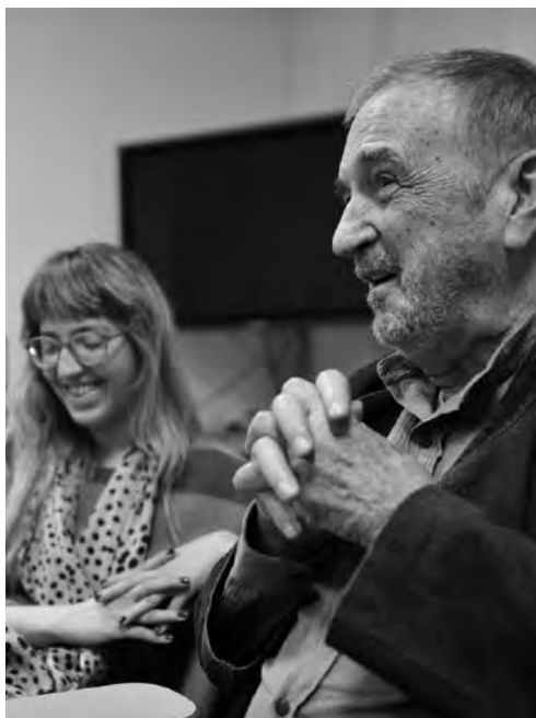
התסריטאי ז'אן-קלוד קרייר סדנת אמן (2012)