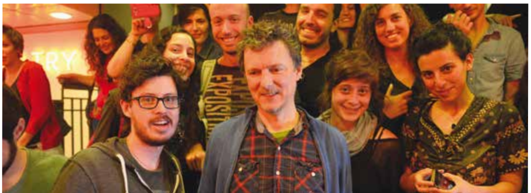
הבמאי מישל גונדרי (צרפת) בבית הספר, מאי 2014

לבית הספר שיקול דעת מלא והזכות הבלעדית לשנות את תוכנית הלימודים וההפקות התלמידים יהיו כפופים לתקנוני בית הספר.