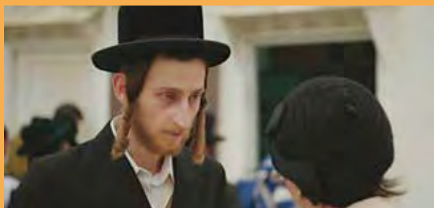
"כיפת ברזל" (2017, 2018) סדרה טלוויזיונית עצמחה ופותחה בבית הספר יוצרים יאב שוטן-גושן , איילת גונדר-גושן ו רעיה שוסטר תסריט יאב שוטן-גושן ו איילת גונדר-גושן חונך אבנר ברנהיימר